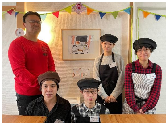
作品を展示しているようす（杉本町みんな食堂）