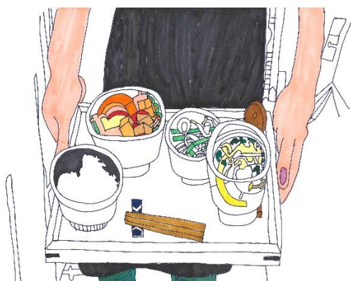
四元雄飛 《杉本町みんな食堂のメニュー》