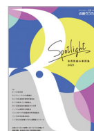
Spotlight - 会員取組み事例集 -