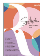
Spotlight - 会員取組み事例集 -