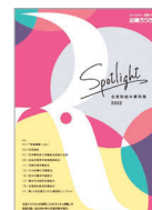
Spotlight - 会員取組み事例集 -